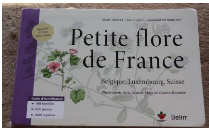
Figure 7 : Si vous ne deviez en acheter qu'une, prenez celle-ci

Quelques références supplémentaires ont été présentées à la fin de l'animation (fig 7 à 9) :