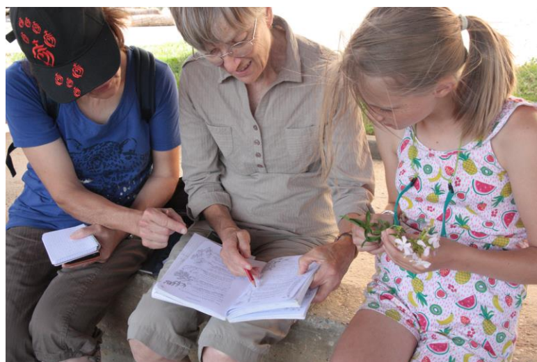
Figure 4 : Caryophyllacée or not Caryophyllacée ?

Les premières étapes se sont déroulées sans accroc, mais assez vite les botanistes en herbe se sont rendus compte que certaines questions pouvaient être assez équivoques (figure 4).