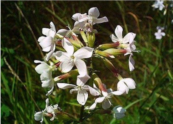
Figure 5: Saponaria officinalis

La première est la Saponaria officinalis , ou saponaire (figure 5). Une caryophyllacée qui pousse généralement dans les milieux humides ou ombragés. La seconde est la Prunella vulgaris , ou Brunelle, une lamiacée commune qu'on trouve souvent dans les gazons (figure 6).