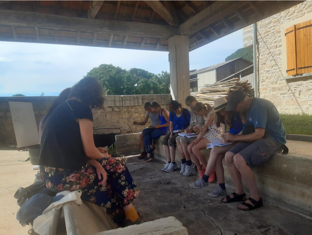
Figure 10 : Aller, on les laisse chercher encore un peu, ils sont si concentrés, mais on espère qu'ils vont rentrer à temps pour le dîner

Merci à tous d'avoir participé. D'autres animations botaniques seront organisées dans l'année. N'hésitez pas à contacter Joachim si vous souhaitez faire des sorties sur la commune ou dans les alentours.