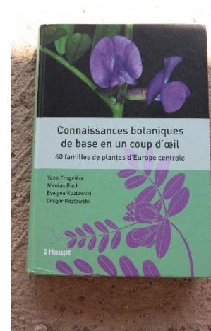
Figure 9 : Pour explorer les familles de plantes