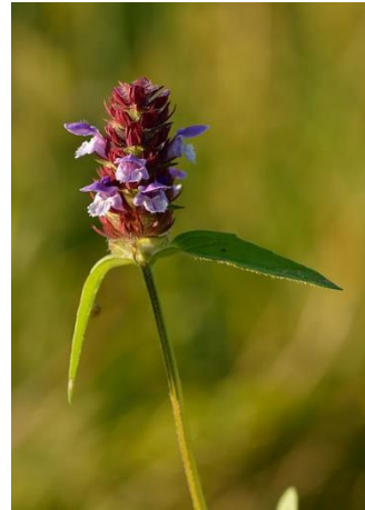
Figure 6: Prunella vulgaris

La conclusion de cette animation a été à l'unanimité « c'est pas évident, il faut pratiquer ! ». Et c'est bien vrai, pour être à l'aise avec une flore à clés il faut l'avoir utilisée souvent, se permettre de sauter les questions trop évidentes et repérer les embranchements problématiques. Mais on rajouterait une chose : cette impression d'avancer laborieusement, d'aller chercher des définitions de mots jargonnant, de se sentir un peu perdu dans les différentes familles, c'est sans doute la façon la plus efficace de découvrir l'univers des plantes et de les comprendre un peu mieux.