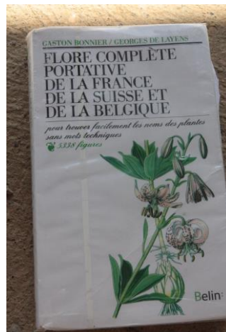
Figure 8 : Plus complète que la Covillot mais plus difficile car moins d'illustrations